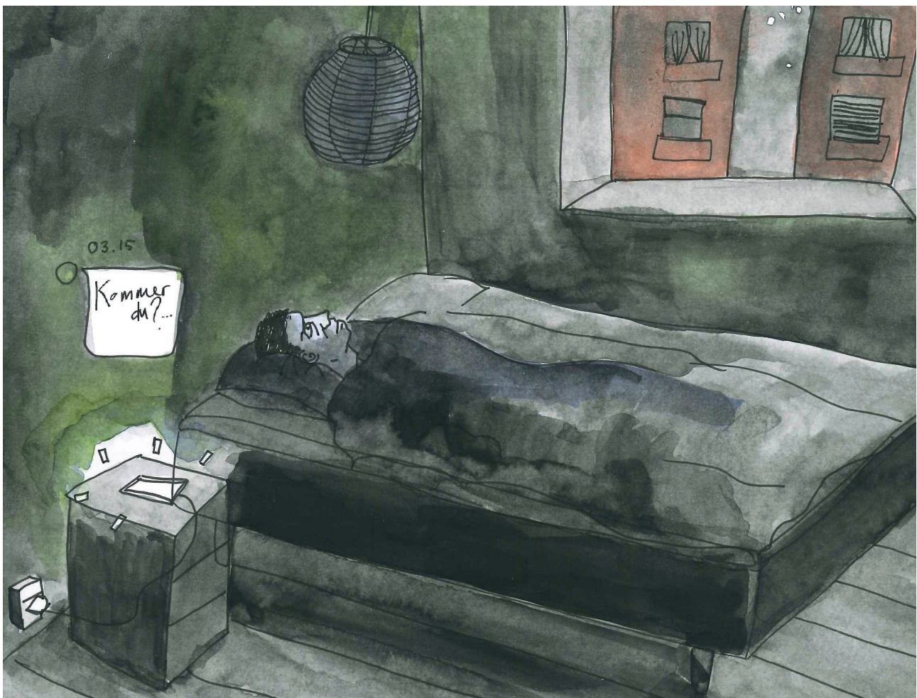
Ungefællesskabet i boligområdet er et livsvilkår, som de unge hele tiden må navigere i forhold til.

I størstedelen af de unges beskrivelser er boligområdet et sted, hvor "alle kender alle", og hvor man enten er nogens nabo, underbo, bror eller søster. Selvom man ikke nødvendigvis er tætte med alle, så ved man, hvem hinanden er.