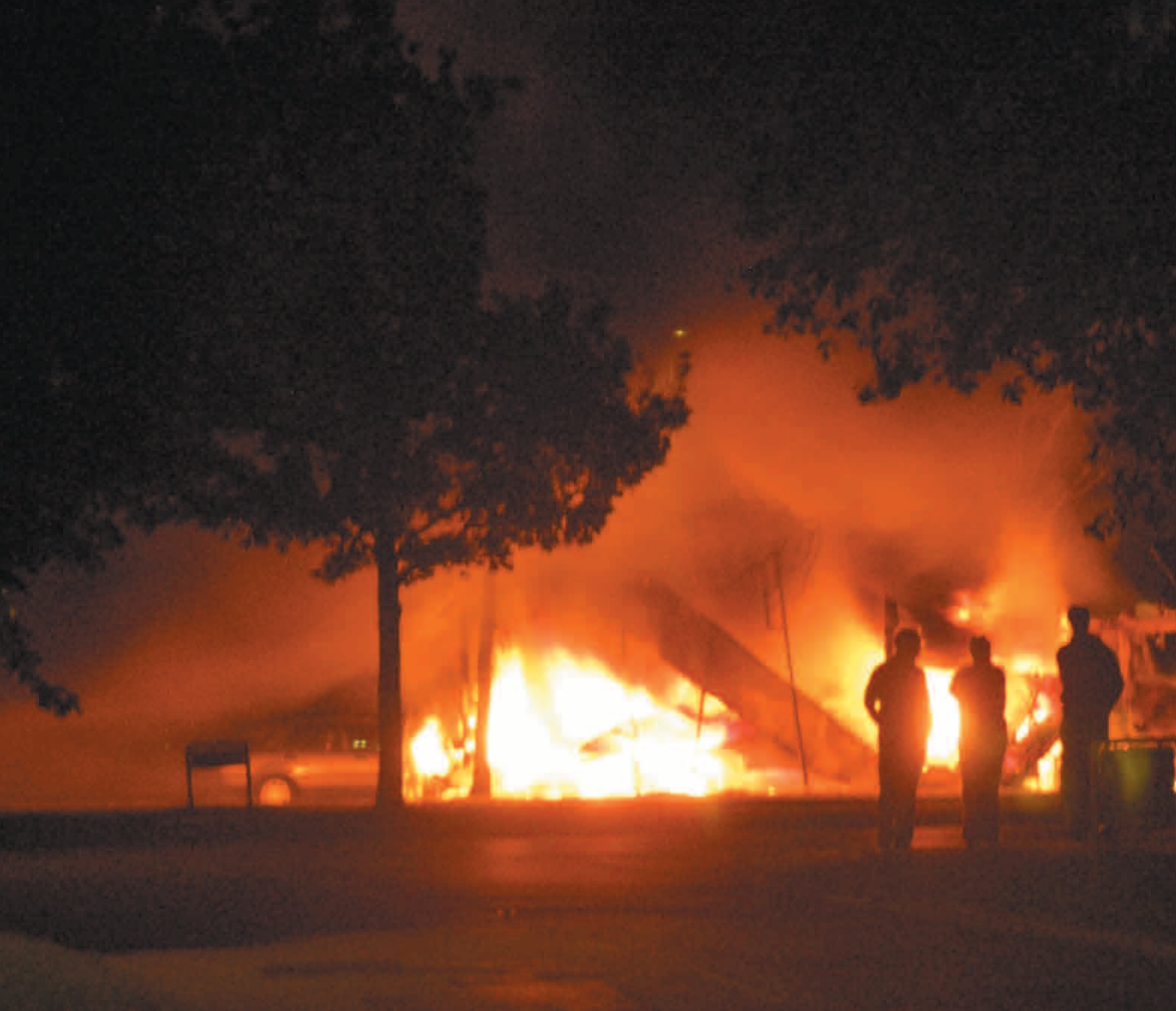
Boligområdet Askerød i Greve har i perioder været plaget af påsatte brande - her en lastbilbrand i 2009.