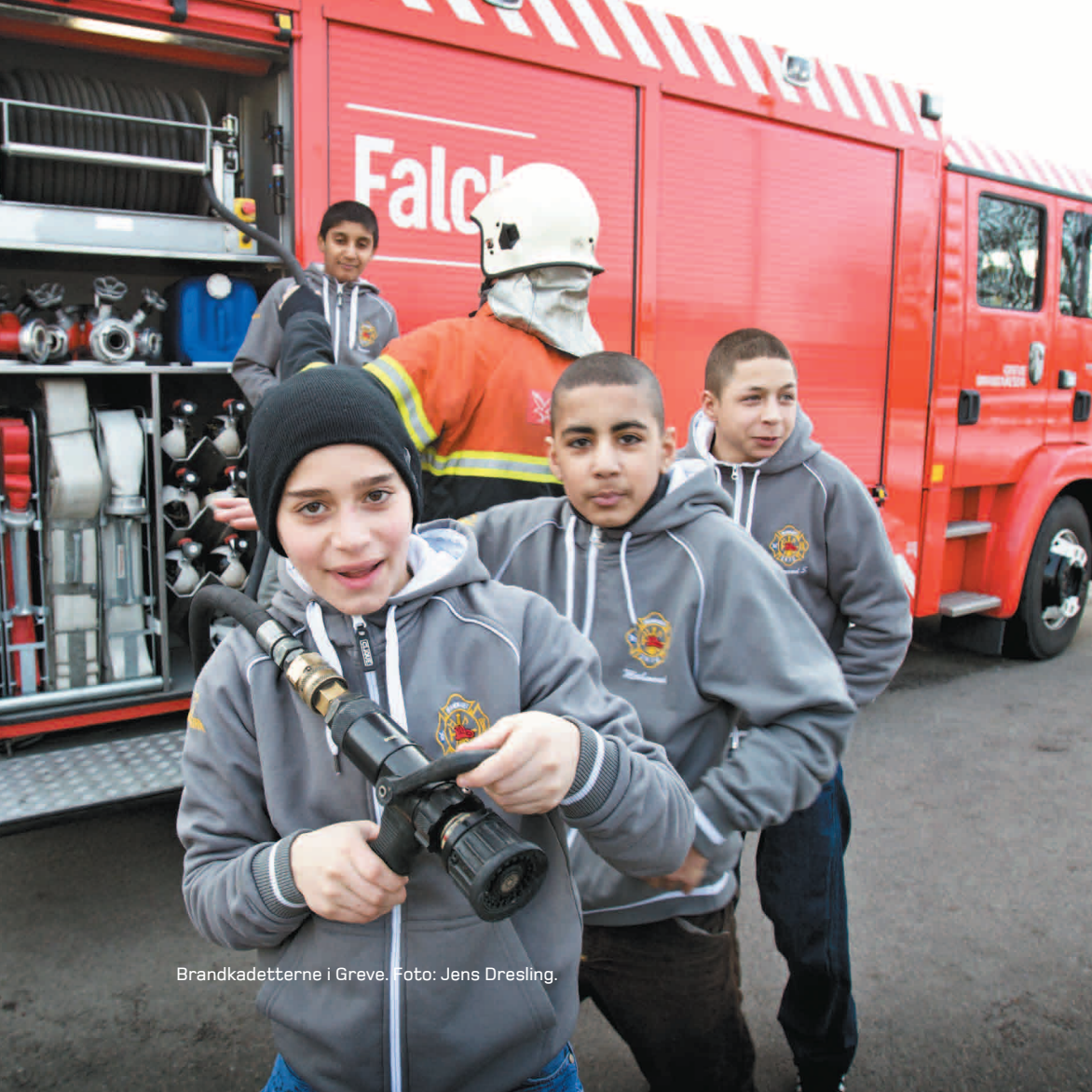
Brandkadetterne i Greve.